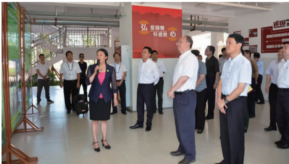
省委副书记、省长尹力在副省长、市委书记叶壮,市委副书记、市长兰开驰、市教育局局长赵敏的陪同下考察我校高中校区

我校的成功创建,标志着全市唯一一所市属高完中又迈上了跨越发展的历史新台阶,为雅安学子开启了“为人生发展而教育”的大门,为雅安教育带来了新的发展机遇和更大的发展空间。